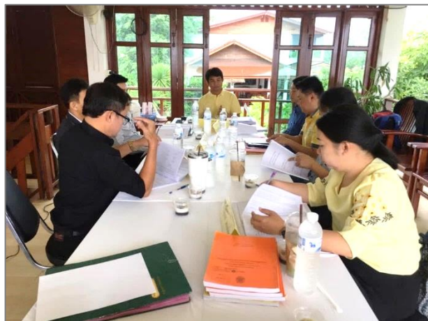
ภาพที่ 1 การติดตามการประกันคุณภาพการศึกษา และการประเมินคุณภาพภายใน ระดับหลักสูตร ประจำปีการศึกษา 2561