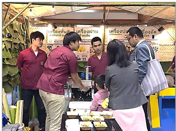
ภาพที่ 5 การส่งเสริมพัฒนางานวิจัยและนวัตกรรม