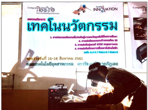
ภาพที่ 9 การประชาสัมพันธ์การจัดการศึกษาและการประกวดแข่งขันทักษะวิชาชีพ