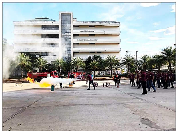
ภาพที่ 4 กิจกรรมเตรียมความพร้อมเพื่อการทำงานและการประกอบอาชีพของนักศึกษา บัณฑิต และศิษย์เก่า