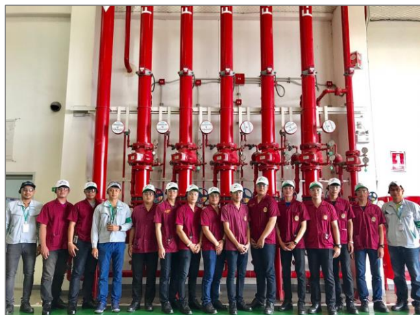
ภาพที่ 3 การพัฒนานักศึกษา