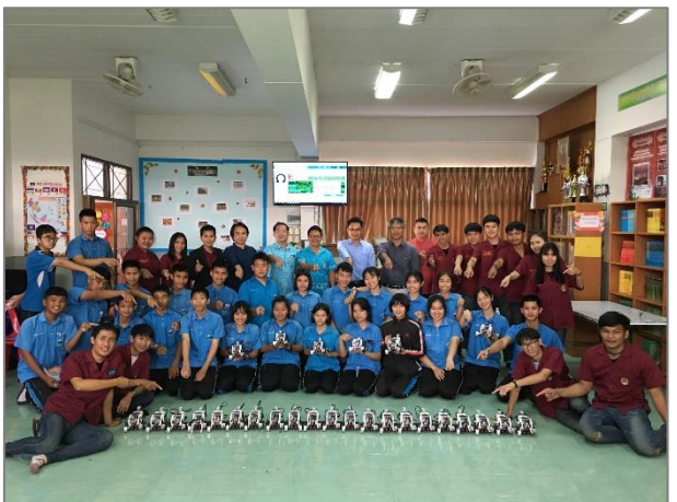
ภาพที่ 6 การบริการวิชาการเพื่อพัฒนาท้องถิ่น