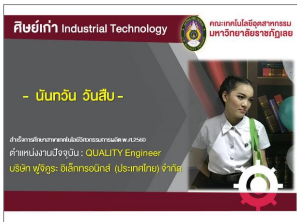
ภาพที่ 11 การมีงานทำของบัณฑิต