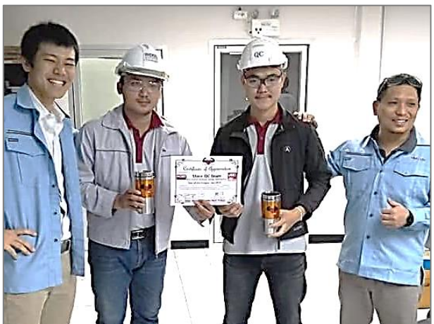
ภาพที่ 10 ผลงานนักศึกษา บัณฑิต และศิษย์เก่า