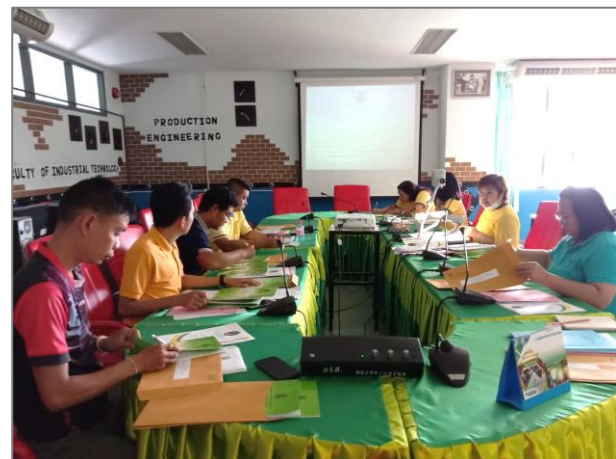
ภาพที่ 2 การพัฒนาอาจารย์และบุคลากร