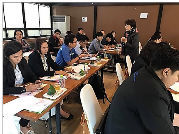
ภาพที่ 8 การประสานเครือข่ายความร่วมมือกับองค์กรภายนอก